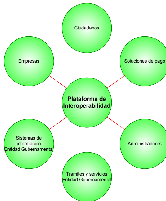
Figura 2. Modelo Hub and Spoke de la Plataforma de Interoperabilidad

De forma conceptual, la PDI actúa como un concentrador inteligente en un modelo radial (hub and spoke). El concentrador es inteligente porque no solo actúa como concentrador y enrutador si no que es posible definir operaciones compuestas en el centro de la estrella que integre servicios de múltiples proveedores 1 .